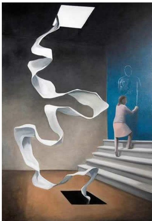
kerk Onze-Lieve-Vrouw Onbevlekt Ver-Assebroek - Brugge kunstenaar Joost Gevaert.

'Mors et vita duello conflixere mirando; dux vitae mortuus regnat vivus'. (Dood en leven, o wonder, hebben samen gestreden). Pasen gloort doorheen de bittere pijn van Goede Vrijdag. Pasen is de diepte van de hemel: 'Een stem uit doodstilte geboren, een lied uit lijnwaad opgestaan'.